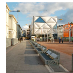
Le Flon, Lausanne